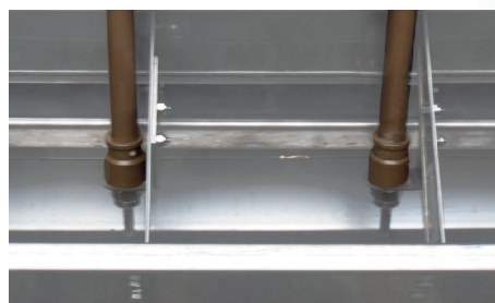
Sistema de nipples , em aço inox, para umidificar a ração.