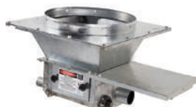
2 saídas retas