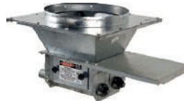
2 saídas paralelas