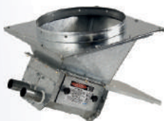
2 saídas paralelas