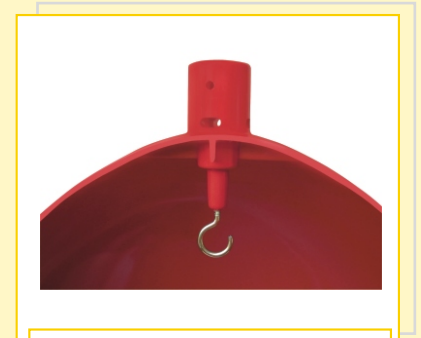
Detalhe da suspensão do contrapeso para matrizes